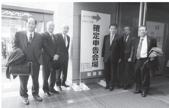
平成29年2月26日（岡山コンベンションセンター）

税理士会が確定申告期に行う税務支援事業の実情に理解を求めするため、後援議員に会場視察を依頼している。今年度は、逢沢一郎議員（岡山1区）の視察が実現した。